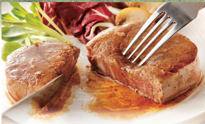
1頭の牛からわずか0.3%程度しかとれないシャトーブリアン。高級なホテルやレストランで提供される稀少な部位を贅沢に厚めにカットしました。